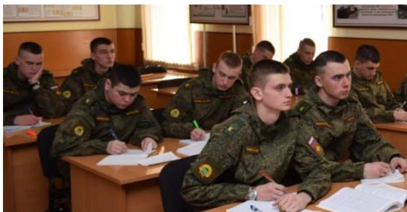
Рисунок 1 – Работа курсантов на стадии осмысления

Приемы, используемые на этом этапе, позволяют организовать осмысленное восприятие текстов, анализ и выбор информации с последующим представлением в графическом виде [4, с. 100].