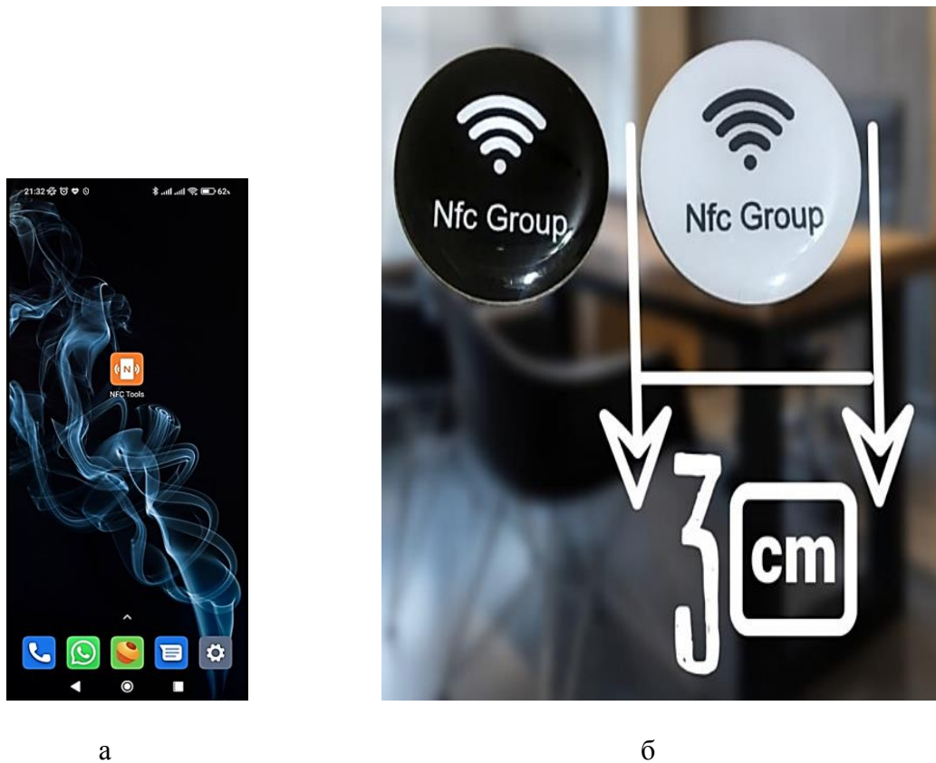
Рисунок 1 – Карточка раненого DD 1380